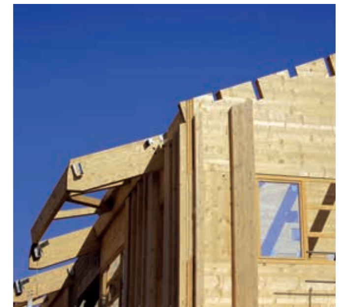
Tragfähiges Know-how bei J.u.A. Frischeis